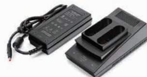
バッテリー・チャージャ