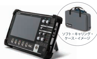
保護ケース (スタンド、ソフト・キャリング・ケース付属) *本体は含まれません