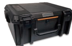
ハード・キャリング・ケース