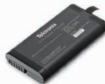
2-BP用スペア・バッテリー