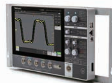
ラックマウント・キット *本体は含まれません