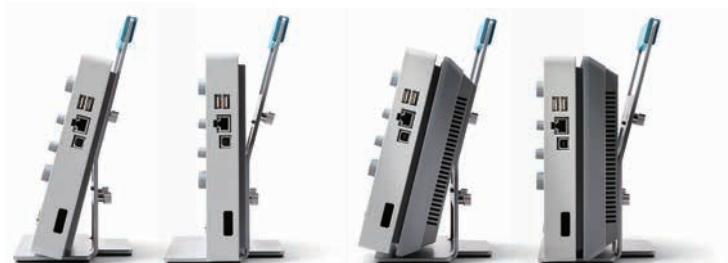
スタンド装着時サイド・ビュー